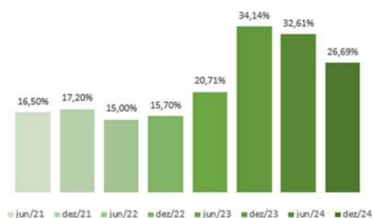
Evolução Semestral do Índice de Basileia